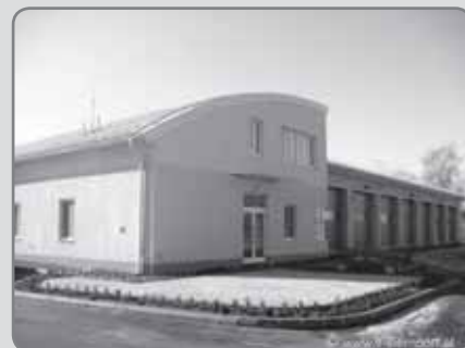
Am dritten Mai ist es soweit. Das neue Zeughaus wird im Rahmen einer Florianimesse eröffnet und gesegnet.

es, die Außenanlagen zu gestalten, um bis zum 3. Mai, dem Datum für die Eröffnungsfeier, alles auf Vordermann gebracht zu haben. Bei diesem Anlass hat auch die Bevölkerung das erste Mal die Gelegenheit, das fertige Zeughaus zu bewundern und einen Rundgang zu machen, um die Räumlichkeiten zu erkunden und um sich einen Überblick über die tollen Möglichkeiten dieses Hauses zu verschaffen. Auch bei Veranstaltungen, wie dem Adventmarkt und einer Blutspendeaktion, konnte sich das neue Zeughaus bereits bewähren. ←