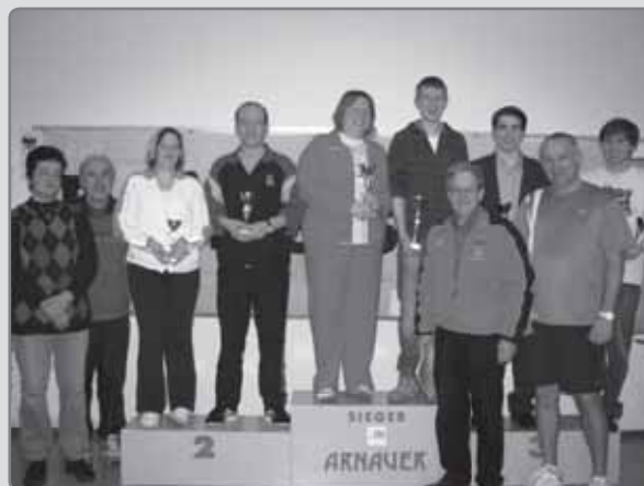
Die Sieger des Raika-Doppel