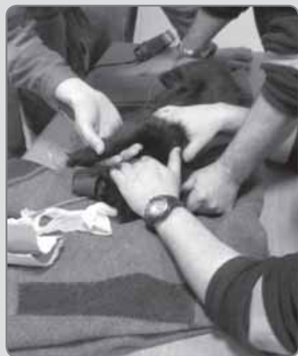
Die Mitglieder der FF Sierndorf halfen dem Tierarzt den Hund zu versorgen.

Kurz nach Anbruch des Valentinstags, um 00:09, wurde die Feuerwehr Sierndorf zu einem technischen Einsatz alarmiert. Zwischen Sierndorf und Oberolberndorf, in Richtung Hollabrunn fahrend, kam ein PKW von der B303 ab, überschlug sich und kam auf einem Acker zu liegen. Die Einsatzkräfte der FF Sierndorf machten sich gemeinsam mit dem Roten Kreuz daran, die Verletzten zu versorgen. Neben dem jungen Pärchen fuhren auch drei Hunde mit.