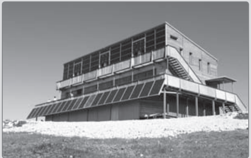
Schiestlhaus, das erste hochalpine Passivhaus; Foto: © Robert Freund

Erreicht werden kann dieser Standard in erster Linie durch ausreichende Wärmedämmung der Gebäudehülle. Weitere Schritte auf dem Weg sind Wärmeschutzverglasung der