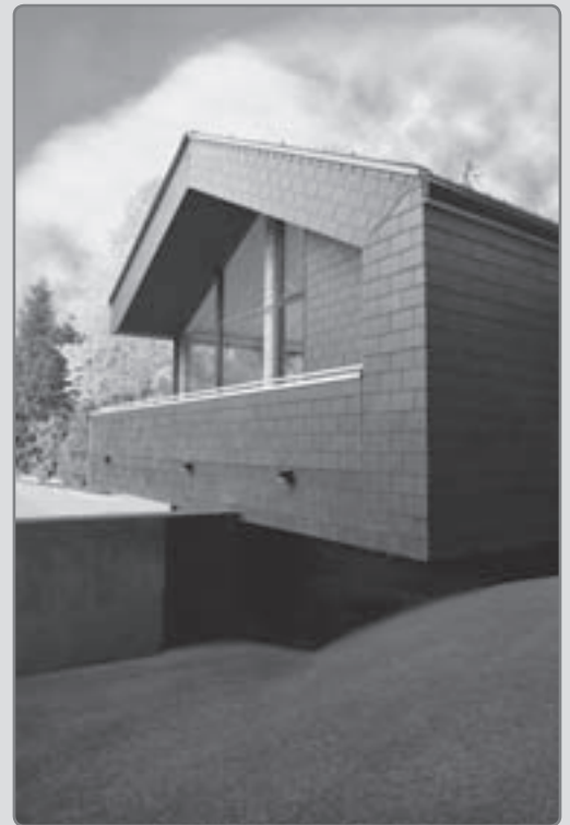
Österreichischer Haus in Whistler Mountain

Die ersten Tage, sobald es hell war, führte der erste Weg zum Display unseres Gleichrichters, um zu sehen, wie viel Strom wir bereits produzieren. Ein tolles Gefühl, sogar bei diesem Wetter zumindest um die 250 Watt zu produzieren, was der Grundstrombedarf unseres Hauses zu sein scheint, Heizungssteuerung, all die Kleinigkeiten, die man sich erst bewusst macht, wenn der Zähler läuft, obwohl doch gar kein Verbraucher im Netz hängt, glaubt man jedenfalls. Wir machen seither Jagd auf alle eingesteckten Geräte, schalten konsequent am Abend alle Verteiler aus, und freuen uns, wenn die Sonne scheint!