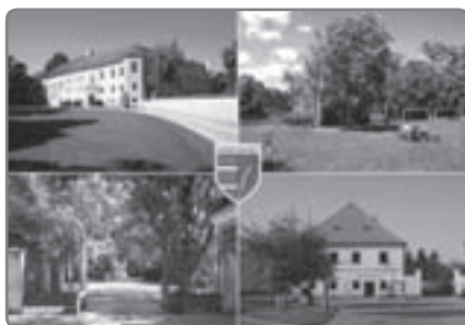
Motive auf der Sierndorf-Postkarte: Schloß Sierndorf und Einfahrt, Erholungszentrum, Gemeindeamt und Wappen der Marktgemeinde Sierndorf.

Dieser Ausgabe der Gemeindezeitung liegt die neue „Sierndorf-Ansichtskarte“ gratis bei. Weitere Ansichtskarten können zum Stückpreis von 50 Cent im Gemeindeamt erworben werden.