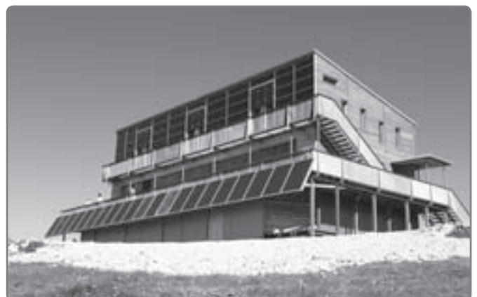
Schiestlhaus, das erste hochalpine Passivhaus

Die Deckelung von Euro 1.000,- wird beibehalten. Die Gemeindeförderungen werden für alle Baumaßnahmen