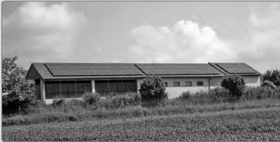
Photovoltaikanlage der Kläranlage Sierndorf

Für die Region Weinviertel-Donauraum wird derzeit ein regionales Energiekonzept erstellt, das umfangreiche Maßnahmen zu den Themen erneuerbare Energie und Energieeffizienz beinhaltet. Das Land Niederösterreich unterstützt die Realisierung dieses Projekts aus Mitteln der ecoplus-Regionalförderung unter Einbindung von EU-Kofinanzierungsmitteln (LEADER).