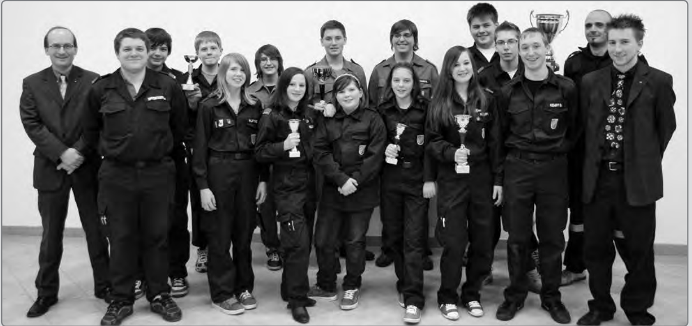
Die Raiffeisenbank Sierndorf ermöglichte den Jungflorianis spannende Rennen.