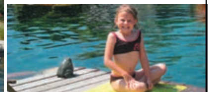
Entspannen am Badesteg